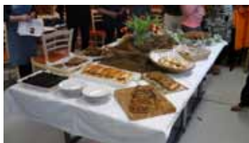
Toimintaa Maa- ja kotitalousnaisten yhdistyksille